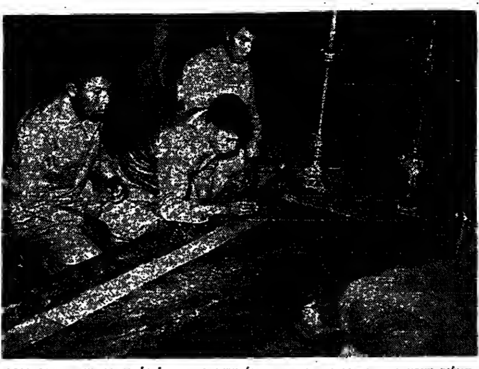
חילום נכבד פרו, והשדרים פרו הדרום של ארץ, במקרים לרוב זה המפואר במדינת הברז

הצעת ישראליות נתקבלו * הטיסה אנטי-ערבית משלוח ירדן נאמנה מבודדת... הצעת ישראליות נתקבלו * הטיסה אנטי-ערבית